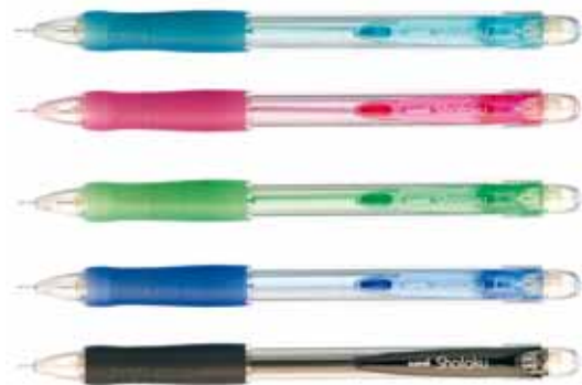
▲ Porte-mines Shalaku M5-100 d'Uni Ball : densité extrême, tracé net, souple et contrasté (noir profond), écriture très douce...

Vous vous êtes peut-être sentis froissés?