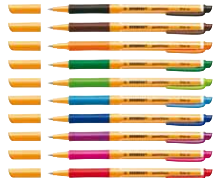
► Stabilo PointVisco : « Une encre révolutionnaire pour donner une nouvelle dimension à l'écriture ».