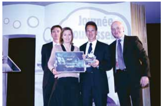
▲ Le 20 mars dernier, lors de la cérémonie annuelle fournisseur du Trophée Lyréco, Pilot a remporté le 1 er prix « Trophée Marketing » pour l'année 2006. Une récompense pour les performances marketing de Pilot en France. Lyréco Group a élu Pilot en tant que 3 ème meilleur fournisseur international.