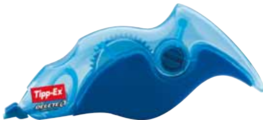
▲ Parmi les produits à valeur ajoutée, Delete a une forme ergonomique « pour un vrai confort d'utilisation », avec grip caoutchouc pour prise en main confortable, corps translucide orange ou bleu, niveau de ruban visible, vis de réglage pour retendre la bande si nécessaire. Sa longueur de ruban : 5 mm x 8,5 mm.

Depuis 1950, ont été vendus 100 milliards de stylos billes Bic dans le monde, et en France, un stylo bille vendu sur deux est un Bic