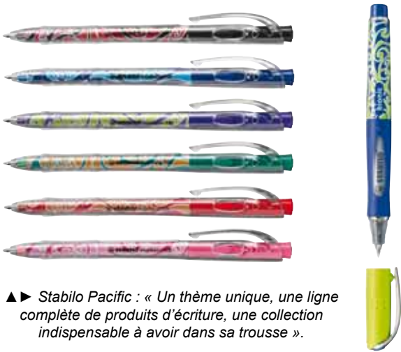
▲► Stabilo Pacific : « Un thème unique, une ligne complète de produits d'écriture, une collection indispensable à avoir dans sa trousse ».

Autre nouveauté, la gamme complète de surligneurs, bille et rollers Stabilo Pacific, « en Edition Limitée, dans l'esprit des tatouages Maori ».