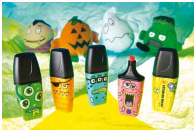
▲ Stabilo prolonge la « success story » des surligneurs en format mini Boss Mini, en lançant deux nouvelles Editions Limitées : Boss Mini pingui, mettant en scène « Mister Pingui » dans 5 univers différents, et Boss Mini monster.