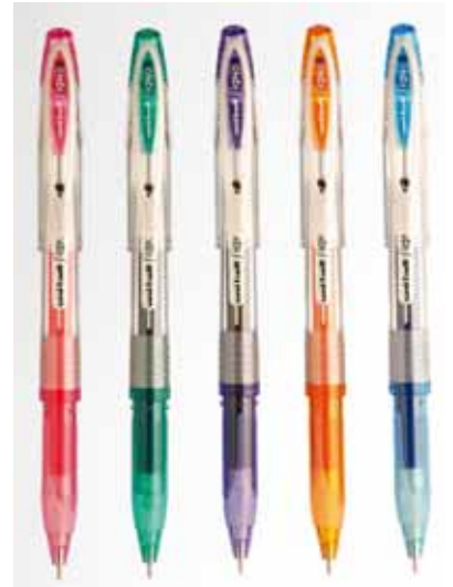
▲ Signo b.i.t d'Uni Ball : un stylo rechargeable.

Le porte-mine Shalaku M5-100 (0,5 mm), rechargeable, est destiné à un usage multiple. « L'écriture est non stop en cas de rupture de la mine, car les mines sont renforcées lors de la fabrication (20 % plus solides que les mines traditionnelles). » Longue durée d'écriture, donc économie ; meilleure prise en main grâce au grip confort ; canon rentrant sécurisant la mine ; corps transparent ; cinq coloris. En vente par boîte de 10 et sur un présentoir de 50 pièces.