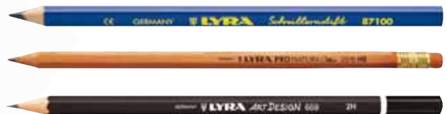
▲ Trois exemples des crayons Lyra...

Lyra propose actuellement des crayons de différents formats (différents diamètres du fin au gros modules ; différentes formes : hexagonal, ergonomique triangulaire...) et dans une large gamme de graduation. « Toutefois la graduation HB reste la plus appréciée par les utilisateurs, car elle constitue un bon compromis entre dureté de la mine et écriture grasse ».