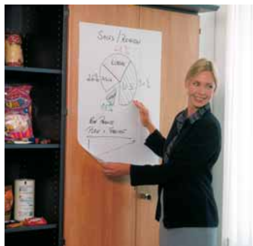
▲ Magic chart : feuille de papier à effet électrostatique, qui adhère sur toutes surfaces lisses (vitres, portes, cloisons...) sans colle ; rouleau de 25 feuilles prédécoupées 60*80 cm (quadrillé ou blanc) ; papier indéchirable, entièrement recyclable ; emballage astucieux ; convient avec des marqueurs effaçables à sec Edding 660.