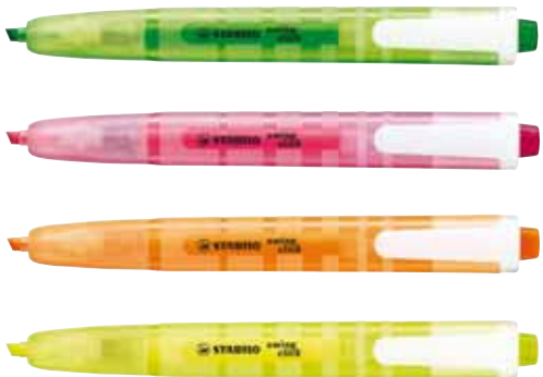
▲ Stabilo swing click : un surligneur de poche pour nomades en puissance...

Un nouveau surligneur tendance et design : Stabilo swing click met en avant sa spécificité « rétractable ».