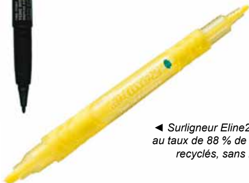
◀ Surligneur Eline2 (SLW10) au taux de 88 % de matériaux recyclés, sans PVC.