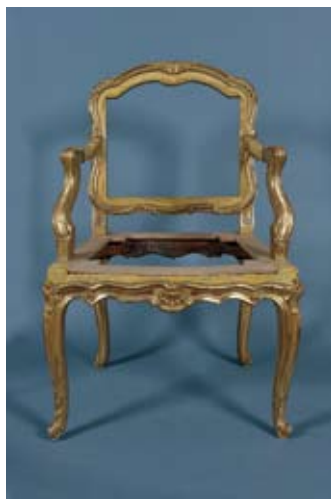
Le travail de restauration de la dorure nécessite l'intervention d'un prestataire extérieur spécialisé en restauration de bois doré et polychromé. L'intervention, près de 400 heures de travail, portera sur la conservation de la dorure d'origine.

voire même utilisé comme cloisonnement, venir compléter le poste de travail.