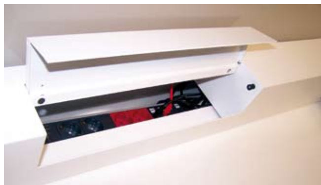
Dans la gamme Dublo de Dynamobel, il est possible de mettre un chemin de câble surélevé au dessus du bureau (en configuration « bench », soit deux tables face à face) qui peut accommoder une petite cloison. Cette option permet une grande capacité d'électrification et inclus des tiroirs à l'extrémité pour entreposer documents.

Mais, le rangement de proximité n'est pas le seul besoin en termes de rangement. Disques durs, tours centrales (en attendant l'avènement des « pads » au sein de l'entreprise), fils et câbles divers doivent tous trouver une place (de préférence cachée) au sein du poste de travail. Ainsi, chemins de câbles, espaces intégrés (et aérés !) pour les unités centrales des ordinateurs, bacs intégrés pour la connectique, etc. sont les « accessoires » de plus en plus en demandes au niveau du poste de travail.