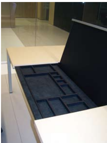
Un exemple de rangement astucieux signé Dynamobel : la table de direction de la gamme Neta.

Certes, les sièges, l'éclairage, le niveau sonore et la température doivent être pris en compte dans l'aménagement des espaces de travail et ces sujets ont été et seront traités à nouveau dans les pages d'Info Buro Mag. L'objectif de ce dossier était de mettre en lumière l'aspect « mobilier » du poste de travail, d'en voir l'état du marché, les tendances et les visions d'avenir.. Nous espérons que nous avons su atteindre ce but en gardant l'intérêt de nos lecteurs.