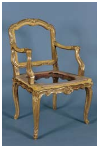
Dans le cadre de sa politique de mécénat, Kinnarps participe au remeublement du Château de Versailles et aide à la restauration du fauteuil de bureau du Dauphin. Par ce mécénat, Kinnarps renoue avec les origines artisanales de son métier. (image : Christian Milet)

Acquis par le Château de Versailles auprès d'un antiquaire américain de Kansas City, le fauteuil est actuellement en cours de restauration dans les ateliers d'ébénisterie du château. Il a été débarrassé de sa garniture de tissu et les pieds qui avaient été tronqués de 5 cm environ sont restaurés aux dimensions originales.