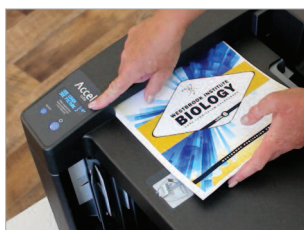
Système permettant de mesurer l'épaisseur de la liasse de feuilles.