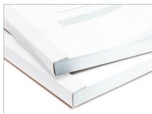
Pour des documents reliés format A4 jusqu'à 150 feuilles.