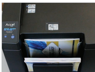
Réception des documents reliés à l'avant de la machine.