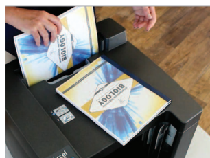
Fente d'insertion des documents à l'arrière de la machine.